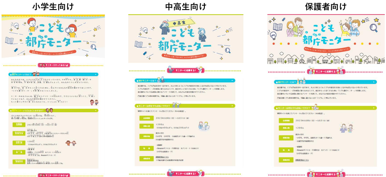
〈応募ページのイメージ〉

当社では今後も、住民と自治体、そして地域間の円滑なコミュニケーションや自治体 DX の推進に向け、最適な業務プロセスの設計から DX ソリューションの選定・提供、業務の実運用まで一貫した自治体業務支援を進めてまいります。