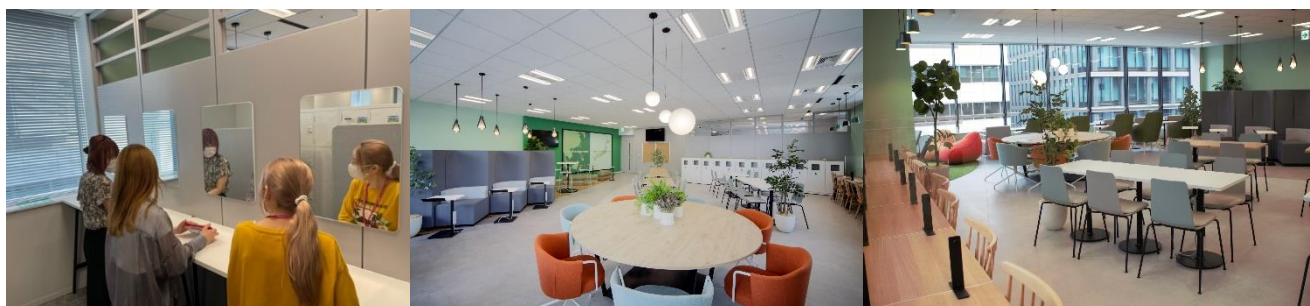
〈ロッカールーム内の身だしなみコーナーや、ひとり席を多く用意した休憩室〉

当社は、『楽しく、安心して働ける、人に優しい職場（コミュニティー）の創出』を行動理念のひとつとして掲げています。これまでも企業内保育所や障がい者の運営によるカフェの開設などを通じて、多様なバックグラウンドを持つ従業員が安心して、長期に亘り勤務できる環境の創出に向け取り組んできました。これからも、経営戦略を軸にした様々な施策を全国で行い、従業員の働きやすい環境づくり、地域特性に応じた拠点展開を推進してまいります。